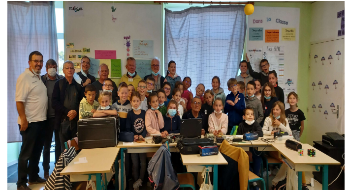
Apprentissage du code morse