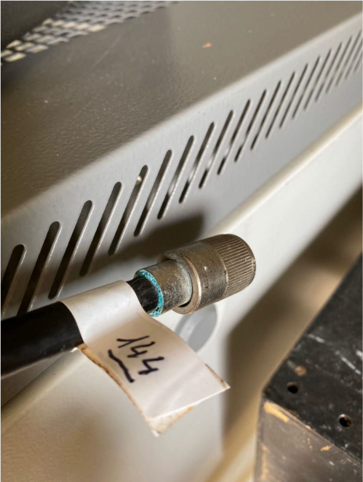
Connecteur Antenne de secours